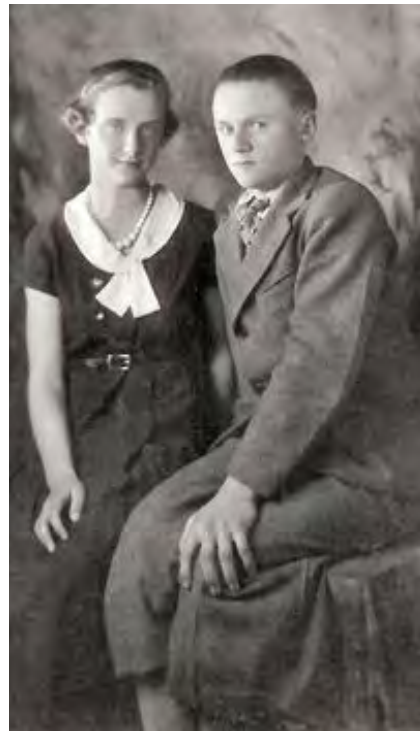
En mars 1935 : avec son frère Xavier