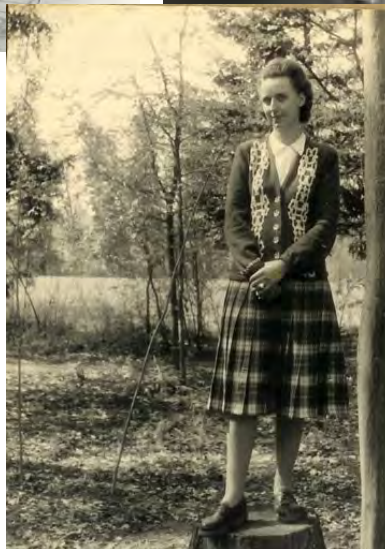
Vers mars 1948 : à Borgo