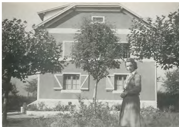
Octobre 1942 : à La Chambre