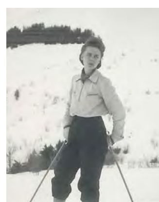
Janvier 1943 : ski à St François