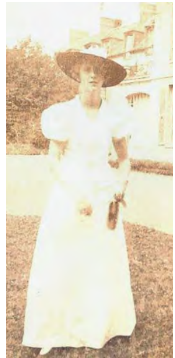
2 septembre 1936 : à Puiseux