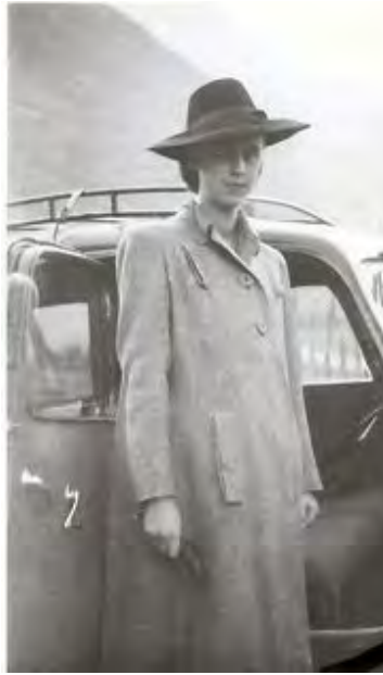
22 octobre 1943 : en voiture